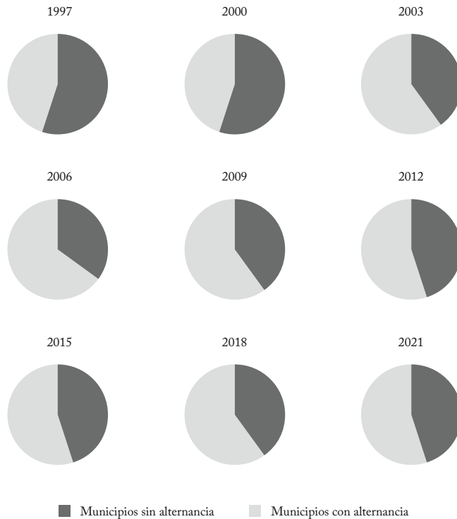
Figura 3. Jalisco: alternancia municipal, 1997-2021

Fuente: Elaboración propia con base en datos del IEPJ Jalisco.